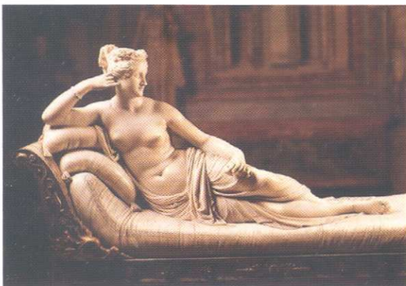
La visita al Museo Borghese fa parte del programma del Convegno dei Soci di Roma (nella foto la famosa scultura del Canova custodita nel Museo, che raffigura Paolina Bonaparte come "Venere vincitrice")

AL SUD Escursione di quattro giorni in Veneto e province confinanti con visite di Ferrara, Venezia, Verona, Sirmione. 18 — 21 Ottobre 2007