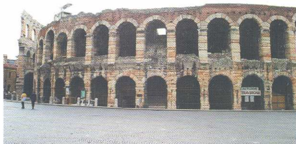
L'Arena di Verona ospiterà al suo interno la Mostra "Presepi da tutto il mondo" meta di una escursione dei Soci del Nord