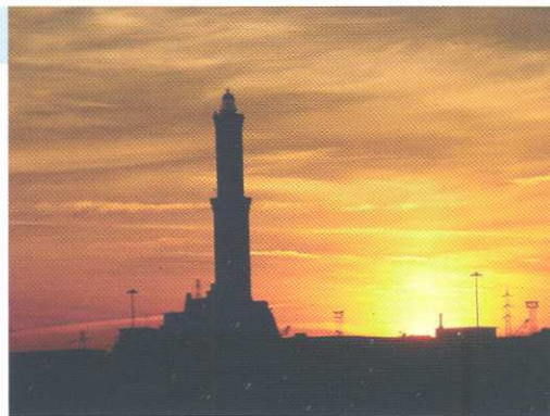
Genova: la Lanterna in controluce al tramonto